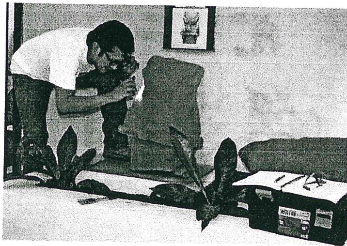
Foto 1: Analizando las esculturas en área de exposición arqueológica (Espigares 2018).

Se asignó número de altar incensario y monumentos a los artefactos que se encontraban pendientes de ese registro en el PANTA.